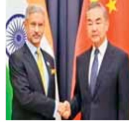
एजेसी ►► अस्ताना

दोनों विदेश मंत्रियों ने सीमा क्षेत्रों में बाकी मुद्दों के शीघ्र समाधान के लिए प्रतिबद्धता दोहराई। बैठक के बाद जयशंकर ने कहा कि दोनों पक्षों में सीमा मुद्दों को हल करने के लिए कूटनीतिक बात होगी।