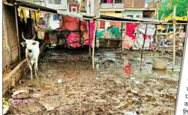
हरिभूमि न्यूज़ ►► गोपाल

राजधानी के करोंद के शांति नगर में सरकारी जमीन पर अवैध रूप से डेयरी और गोशाला संचालित करने का मामला बुधवार को सामने आया है। गोशाला में 78 गाय रखी थीं। इन गायों के लिए न तो कोई छत थी और न खाने की व्यवस्था। प्रशासन ने मंगलवार को अतिक्रमण हटाकर सभी गायों को निापानिया स्थित गोशाला में शिफ्ट कर दिया है। अतिक्रमण मुक्त कराई गई जमीन की कीमत तीन करोड़ रुपए आंकी गई है।