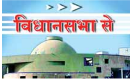
हरिभूमि न्यूज़ ►► गोपाल