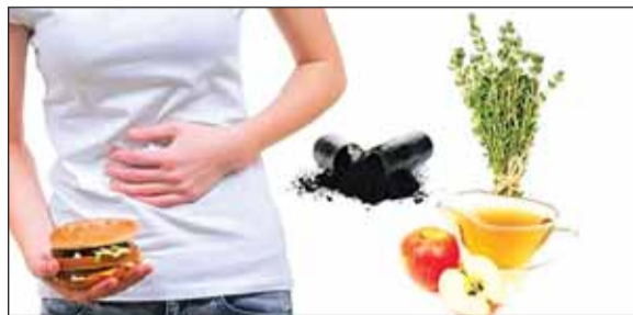
हरिभूमि न्यूज़ ►► जांजगीर चापा

छत्तीसगढ़ के जांजगीर चापा जिले में एक ही परिवार के 12 सदस्यों को फूड पॉइजनिंग हो गया। सभी को इलाज के लिए अस्पताल में भर्ती कराया गया है। जांजगीर चापा जिले के कनई गांव में एक ही परिवार के 12 सदस्यों को फूड पॉइजनिंग हो गया। बताया जा रहा है कि सभी की मशरूम खाने से तबीयत बिगड़ गई। सभी को इलाज के लिए अस्पताल